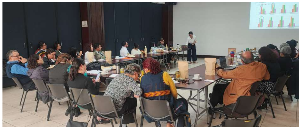
A formação docente e o diagnóstico precoce melhoram a leitura e a escrita dos alunos.